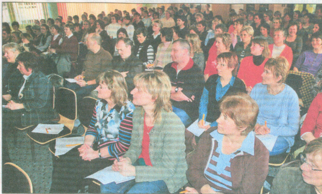
Die Aula der Gardelegener Wanderschule war bei der Fortbildungsveranstaltung am Mittwochmittag fast bis auf den letzten Platz besetzt.

Doch es waren viel mehr, die wissen wollten, ob und wie sich Mädchen und Jungen beispielsweise beim Lernen unterscheiden. Während zweier sehr lehrreicher und auch unterhaltsamer Stunden erfuhren sie unter anderem, dass es gleichwohl weiche Jungen als auch aggressive Mädchen gibt, dass die Natur das weibliche Prinzip bevorzugt, bevor in der siebenten Schwangerschaftswoche mit dem Umliegen des so genannten TDF-Schalters das Y-Chromosom seine Arbeit aufnimmt, dass Jungen zumeist erst handeln und dann denken, was bei den Mädchen meist umgekehrt ist, dass die Jungen mehr über Formen und Augen und Mädchen mehr über das Ohr lernen und reines Denken bevorzugen sowie Jungen sich schneller ablenken lassen. Und die Unterschiede hatte er bereits am Anfang deutlich gemacht, als er zwei Zeichnungen von Häusern präsentierte. Während das Mädchen das